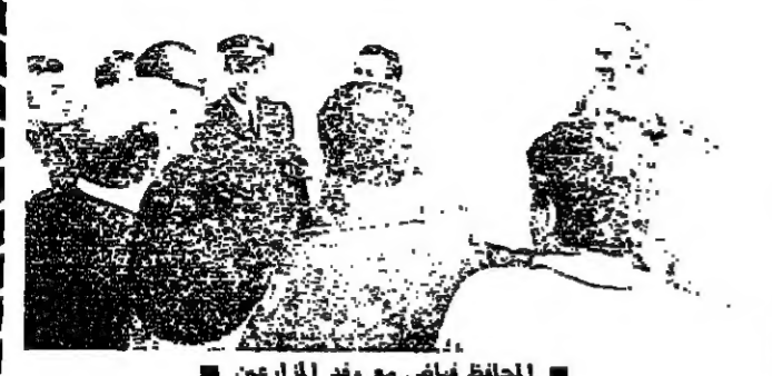
الحلقة تلمس مع وفد المرارين